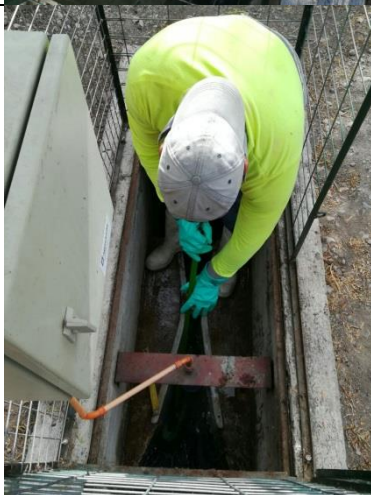
Limpieza canaleta Parshall