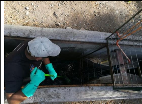
Limpieza canaleta Parshall