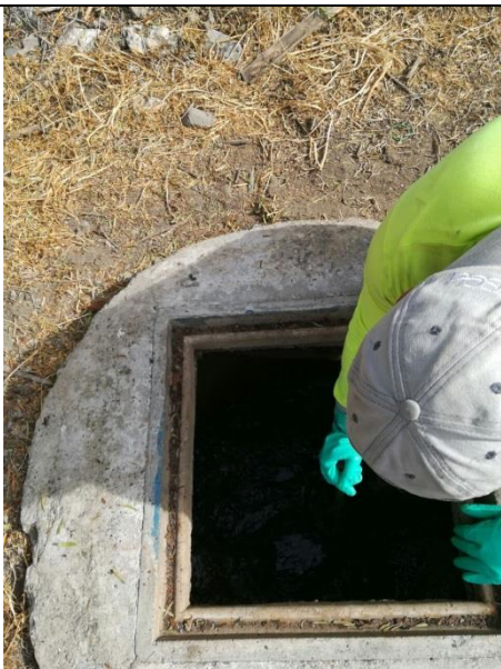
Limpieza cámara anterior a canaleta Parshall