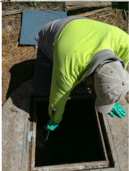
Limpieza cámara anterior a canaleta Parshall